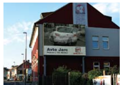
> Čez dan